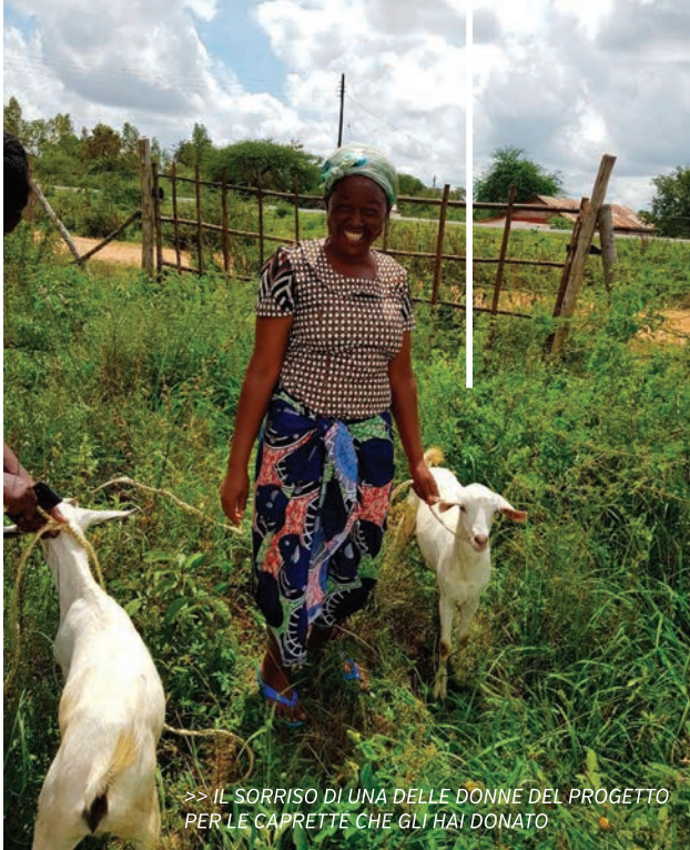
>> IL SORRISO DI UNA DELLE DONNE DEL PROGETTO PER LE CAPRETTE CHE GLI HAI DONATO

Tutte le donne coinvolte si occupano dell'intero ciclo produttivo: semina, cura della crescita, pulizia, irrigazione, raccolta e vendita del raccolto al mercato locale.