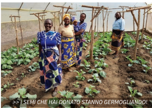
>> I SEMI CHE HAI DONATO STANNO GERMOGLIANDO!

Le caprette danno tanto latte, che viene sia venduto che consumato dalle lavoratrici.