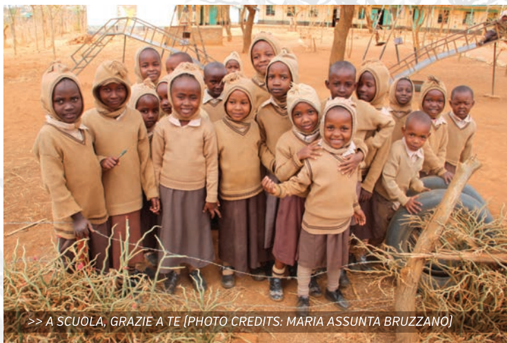
>> A SCUOLA, GRAZIE A TE