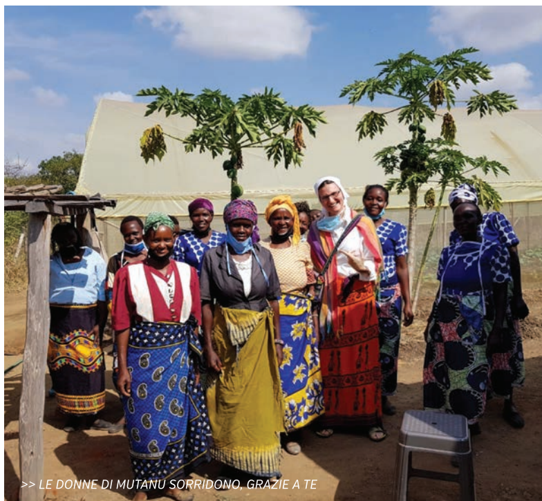
>> LE DONNE DI MUTANU SORRIDONO, GRAZIE A TE

"Insieme abbiamo gettato un grande seme, che diventerà una grande pianta".