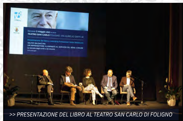
>> PRESENTAZIONE DEL LIBRO AL TEATRO SAN CARLO DI FOLLIGNO